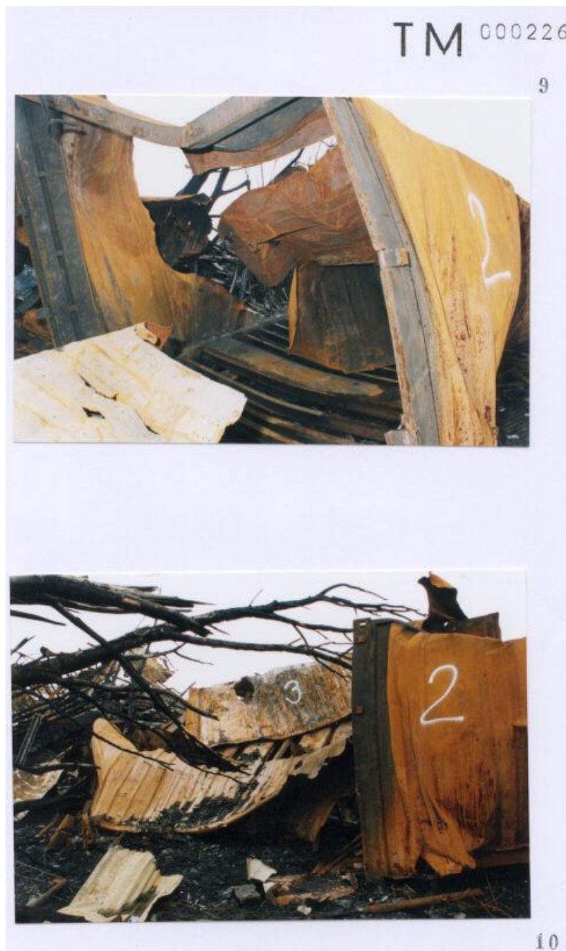
Foto 9 met een door Technisch onderzoek gegeven nummer 2 aan een container. Foto 10 met een door Technisch onderzoek gegeven nummer 2 en 3 aan een container.

Blijft zeer discutabel of deze nummering op containers overeen komt met de werkelijkheid. ( zie inleiding eerste pagina )