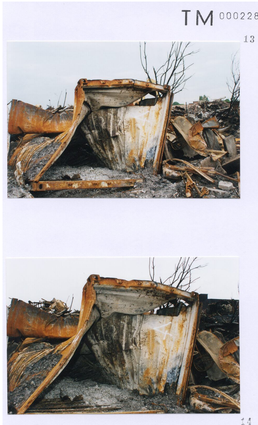
Foto 13 met een door Technisch onderzoek gegeven nummer 4 aan een container. Foto 14 met een door Technisch onderzoek gegeven nummer 4 aan een container.

Blijft zeer discutabel of deze nummering op containers overeen komt met de werkelijkheid. ( zie inleiding eerste pagina )