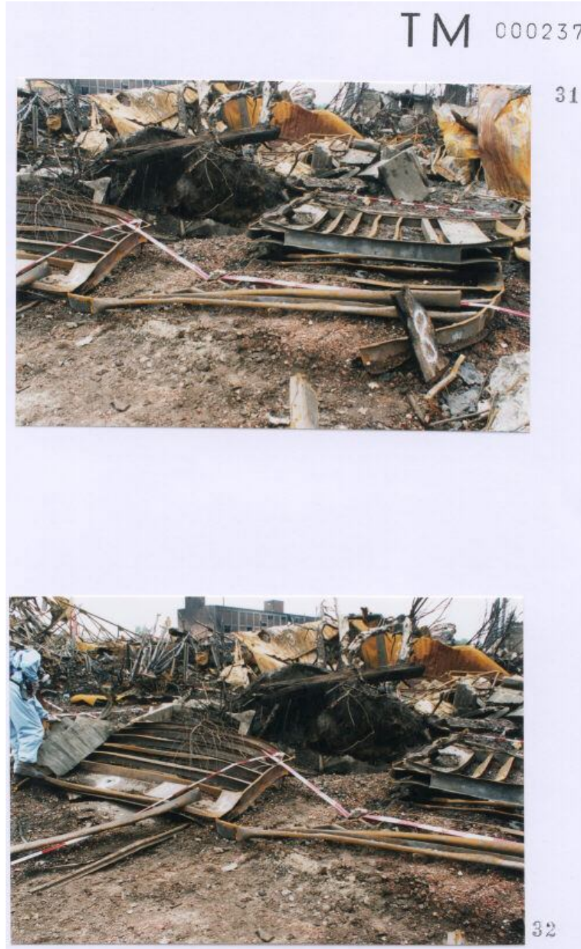
Foto 31 met een door Technisch onderzoek gegeven nummer 3 en 8 aan een container. Foto 32 met een door Technisch onderzoek gegeven nummer 3 en 2 ( 2 : zeer waarschijnlijk ) aan een container.

Blijft zeer discutabel of deze nummerring op containers overeen komt met de werkelijkheid. ( zie inleiding eerste pagina )