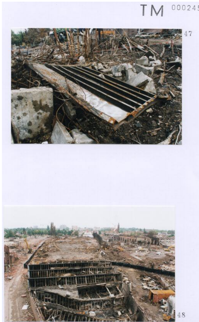
Foto 47 met een door Technisch onderzoek gegeven nummer 13 aan een container. Foto 48 met een door Technisch onderzoek gegeven nummer ???? aan een container.

Blijft zeer discutabel of deze nummerring op containers overeen komt met de werkelijkheid. ( zie inleiding eerste pagina )