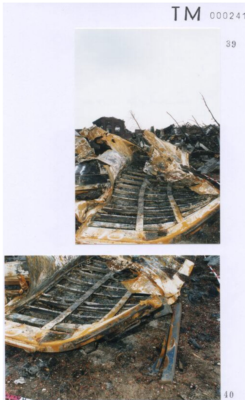
Foto 39 met een door Technisch onderzoek gegeven nummer 10 aan een container. Foto 40 met een door Technisch onderzoek gegeven nummer 10 aan een container.

Blijft zeer discutabel of deze nummering op containers overeen komt met de werkelijkheid. ( zie inleiding eerste pagina )