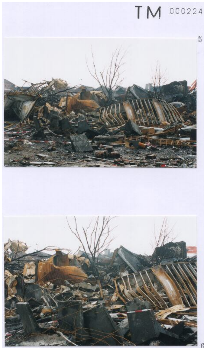
Foto 5 met een door Technisch onderzoek gegeven nummer 1 aan een container. Foto 6 met een door Technisch onderzoek gegeven nummer 1 en 2 aan een container.

Blijft zeer discutabel of deze nummering op containers overeen komt met de werkelijkheid. ( zie inleiding eerste pagina )