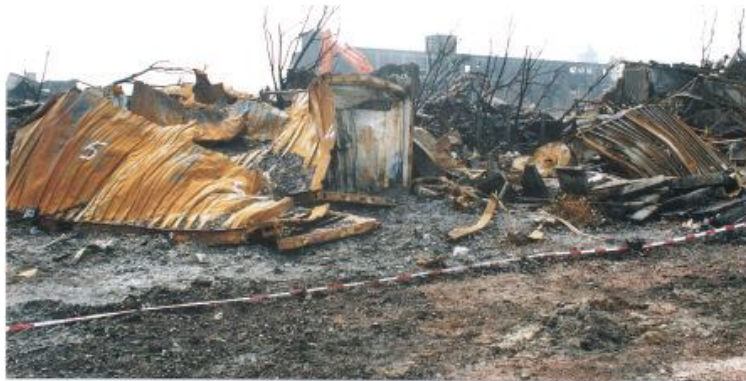
Foto TM 000230 met een door Technisch onderzoek gegeven nummer 4 en 5 aan een container.

Foto TM 000230 met een door Technisch onderzoek gegeven nummer 4 en 5 en 1 aan een container.