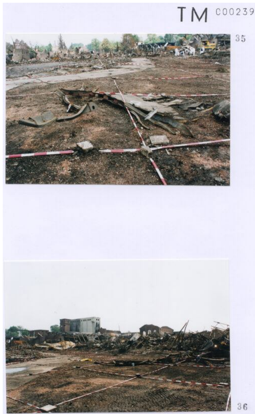
Foto 35 met een door Technisch onderzoek gegeven nummer 9 aan een container. Foto 36 met een door Technisch onderzoek gegeven nummer 9 aan een container.

Blijft zeer discutabel of deze nummerring op containers overeen komt met de werkelijkheid. ( zie inleiding eerste pagina )