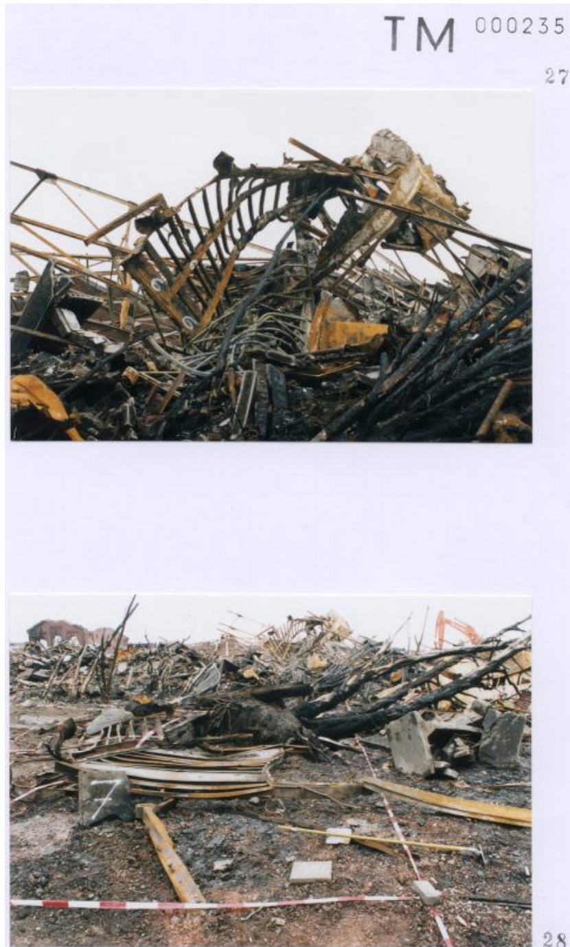
Foto 27 met een door Technisch onderzoek gegeven nummer 6 aan een container. Foto 28 met een door Technisch onderzoek gegeven nummer 7 aan een container. ( op de achtergrond, aanzienlijk verwijderd bij nummer 7 weg , container 6 door onderzoekers genummerd. Dit gegeven is vreemd , gelet op de nummerring )

Blijft zeer discutabel of deze nummerring op containers overeen komt met de werkelijkheid. ( zie inleiding eerste pagina )