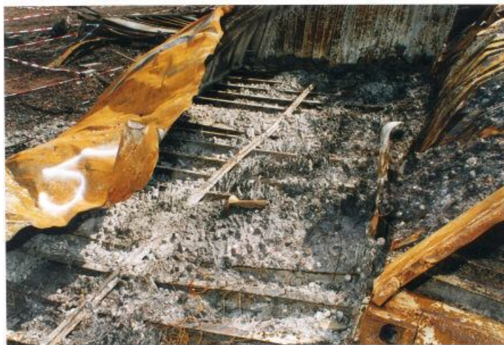
Foto 21 met een door Technisch onderzoek gegeven nummer 5 aan een container. Foto 22 met een door Technisch onderzoek gegeven nummer 5 aan een container.

Blijft zeer discutabel of deze nummering op containers overeen komt met de werkelijkheid. ( zie inleiding eerste pagina )