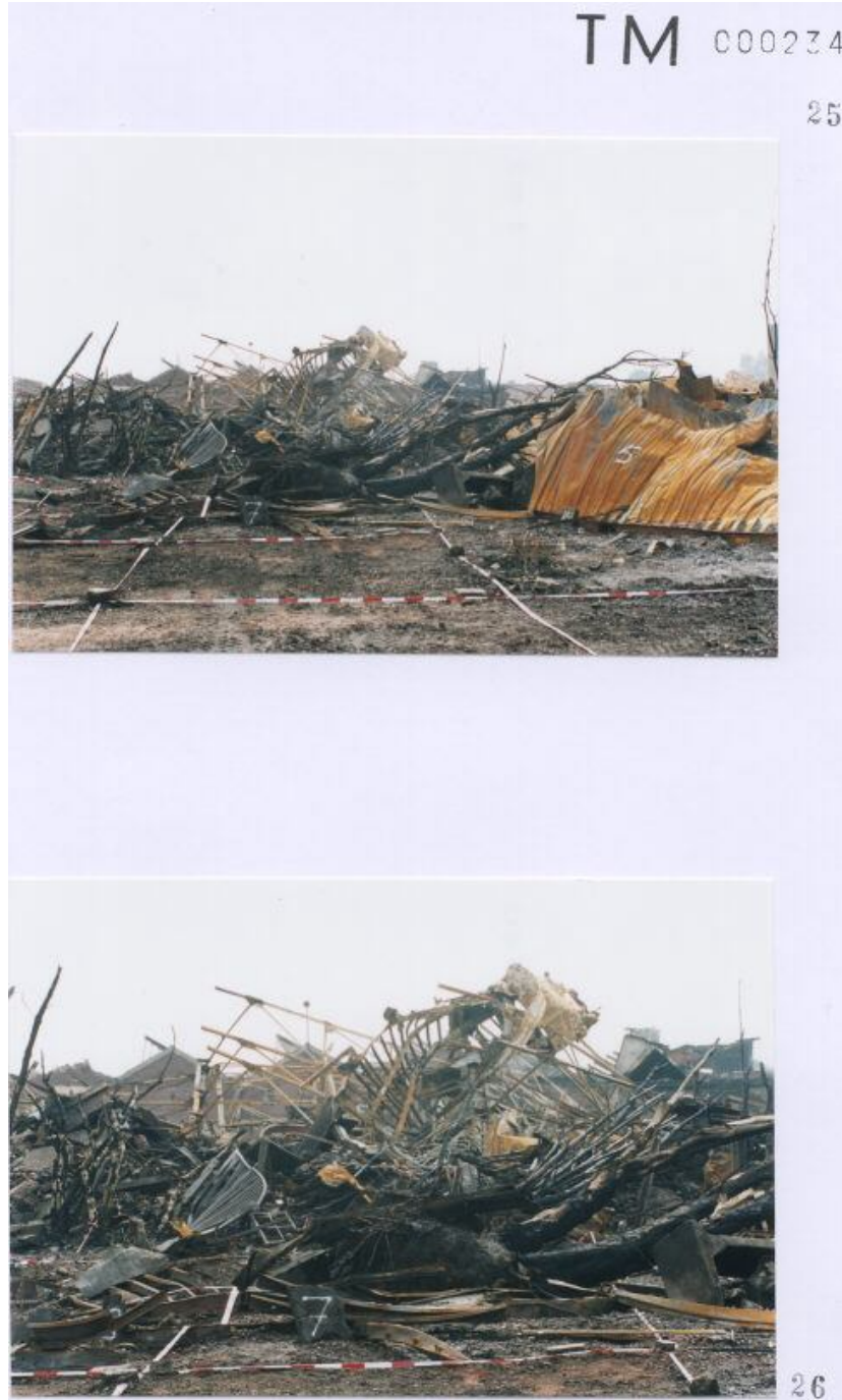
Foto 25 met een door Technisch onderzoek gegeven nummer 5 en 7 aan een container. Foto 26 met een door Technisch onderzoek gegeven nummer 6 ( 6 : midden foto ) en 7 en 8 ( 8 : zeer waarschijnlijk links onder in de foto ) aan een container.

Blijft zeer discutabel of deze nummerring op containers overeen komt met de werkelijkheid. ( zie inleiding eerste pagina )