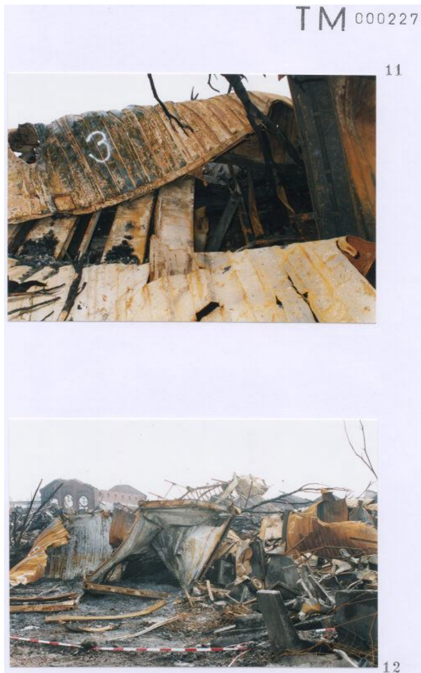
Foto 11 met een door Technisch onderzoek gegeven nummer 3 aan een container. Foto 12 met een door Technisch onderzoek gegeven nummer 2 en 4 en 5 aan een container.

Blijft zeer discutabel of deze nummering op containers overeen komt met de werkelijkheid. ( zie inleiding eerste pagina )