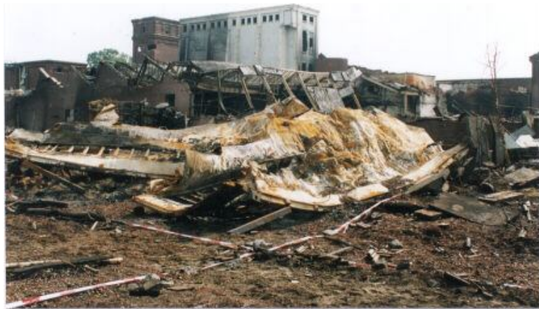
Foto 37 met een door Technisch onderzoek gegeven nummer 10 aan een container. Foto 38 met een door Technisch onderzoek gegeven nummer 10 aan een container.

Blijft zeer discutabel of deze nummering op containers overeen komt met de werkelijkheid. ( zie inleiding eerste pagina )