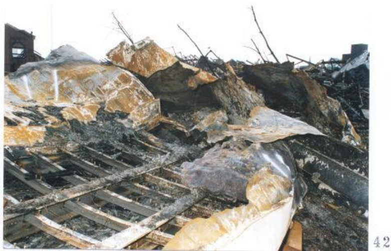
Foto 41 met een door Technisch onderzoek gegeven nummer 11 aan een container. Foto 42 met een door Technisch onderzoek gegeven nummer 11 aan een container.

Blijft zeer discutabel of deze nummering op containers overeen komt met de werkelijkheid. ( zie inleiding eerste pagina )