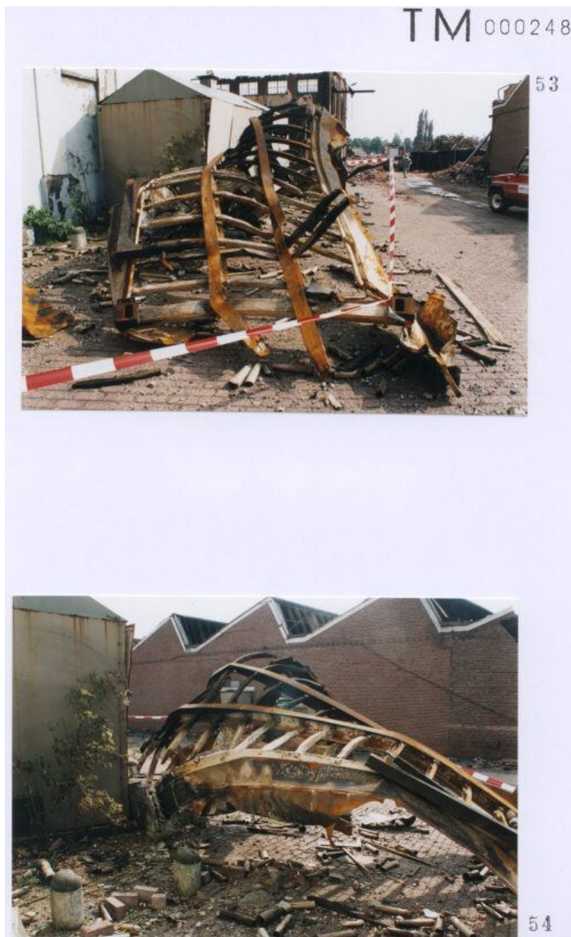
Foto 53 met een door Technisch onderzoek gegeven nummer ???? aan een container. Foto 54 met een door Technisch onderzoek gegeven nummer ???? aan een container.

Blijft zeer discutabel of deze nummering op containers overeen komt met de werkelijkheid. ( zie inleiding eerste pagina )