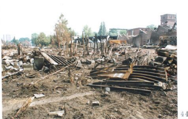
Foto 43 met een door Technisch onderzoek gegeven nummer 11 aan een container. Foto 44 met een door Technisch onderzoek gegeven nummer 12 aan een container.

Blijft zeer discutabel of deze nummering op containers overeen komt met de werkelijkheid. ( zie inleiding eerste pagina )