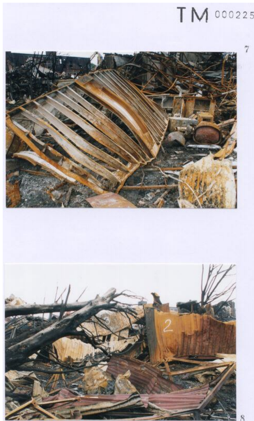
Foto 7 met een door Technisch onderzoek gegeven nummer 1 aan een container. Foto 8 met een door Technisch onderzoek gegeven nummer 2 en 3 aan een container.

Blijft zeer discutabel of deze nummering op containers overeen komt met de werkelijkheid. ( zie inleiding eerste pagina )