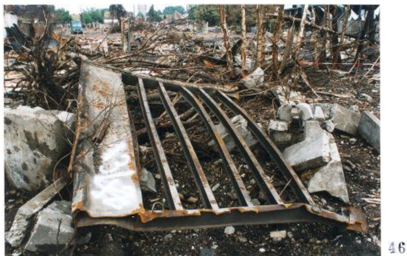
Foto 45 met een door Technisch onderzoek gegeven nummer 12 aan een container. Foto 46 met een door Technisch onderzoek gegeven nummer 13 aan een container.

Blijft zeer discutabel of deze nummering op containers overeen komt met de werkelijkheid. ( zie inleiding eerste pagina )