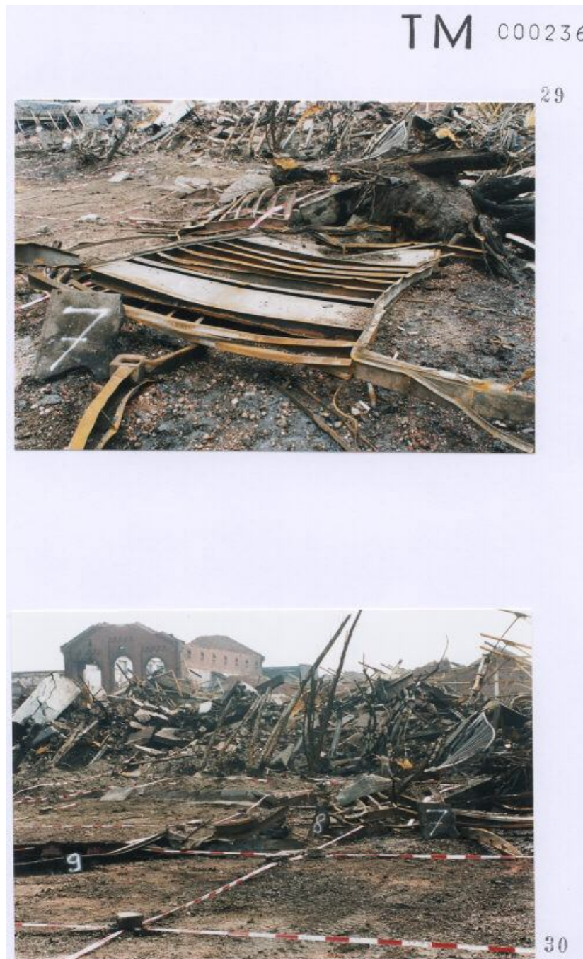
Foto 29 met een door Technisch onderzoek gegeven nummer 7 ( nummer op tegel ) aan een container.

Foto 30 met een door Technisch onderzoek gegeven nummer 7 en 8 en 9 ( nummers op tegel ) aan een container.